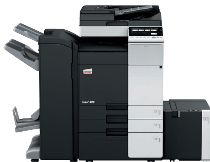
ineo+ 308 con alimentador dual scan (DF-704), finalizador grapador/plegador (FS-534SD), cassette gran capacidad (LU-302) y mesa cassette (PC-410)