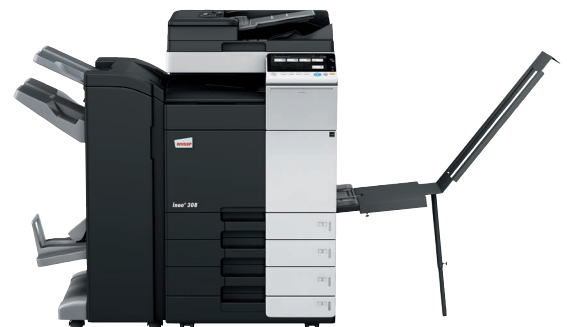
ineo+ 308 con alimentador dual scan (DF-704), finalizador grapador/plegador (FS-534SD), bandeja (BT-C1e) y mesa cassette (PC-210)