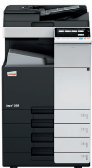
ineo+ 308 con alimentador dual scan (DF-704), bandeja de salida (OT-506) y mesa cassette (PC-210)

Invierta en una ineo+ 308 y se olvidará de depender de empresas externas para trabajos especializados como invitaciones impresas en papel grueso y de alta calidad. Esto le ahorrará tiempo y dinero. La ineo+ 308 admite sobres, papel reciclado, papel preimpreso, transparencias, y muchos otros formatos, incluso tarjetas de hasta 300 g/m 2 . Este sistema puede imprimir una amplia gama de formatos de papel desde A6 hasta SRA3 o formatos especiales definidos por el usuario y banners de hasta 1.2 metros de longitud. Las numerosas opciones de acabado permiten la creación de folletos de hasta 80 páginas, documentos con varios acabados como grapados o perforados. La ineo+ 308 puede realizar casi cualquier tipo de acabado.